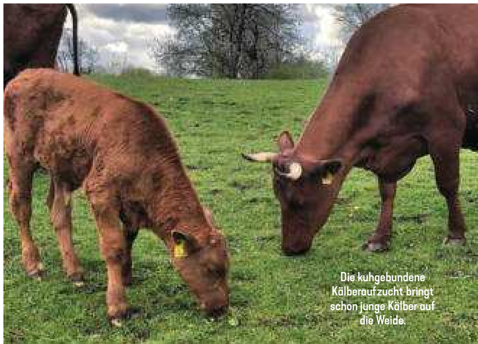
Die kuhgebundene Kälberaufzucht bringt schon junge Kälber auf die Weide.

in der Praxis, dass die kuhgebundenen Kälber mit frühem Weidegang nicht zwangsläufig stärker mit Parasiten befallen sind. Eine aktuelle Studie des Thünen-Instituts auf sieben Betrieben ergab: Weiden die Kälber gemeinsam mit erwachsenen Tieren, reduziert dies den Parasitendruck. Auch das regelmäßige Wechseln der Weide alle zwei bis vier Wochen entlastet die Kälber. Trotzdem sollten Bio-Tierhalter:innen die Tiere regelmäßig auf Anzeichen einer Parasiteninfektion kontrollieren.